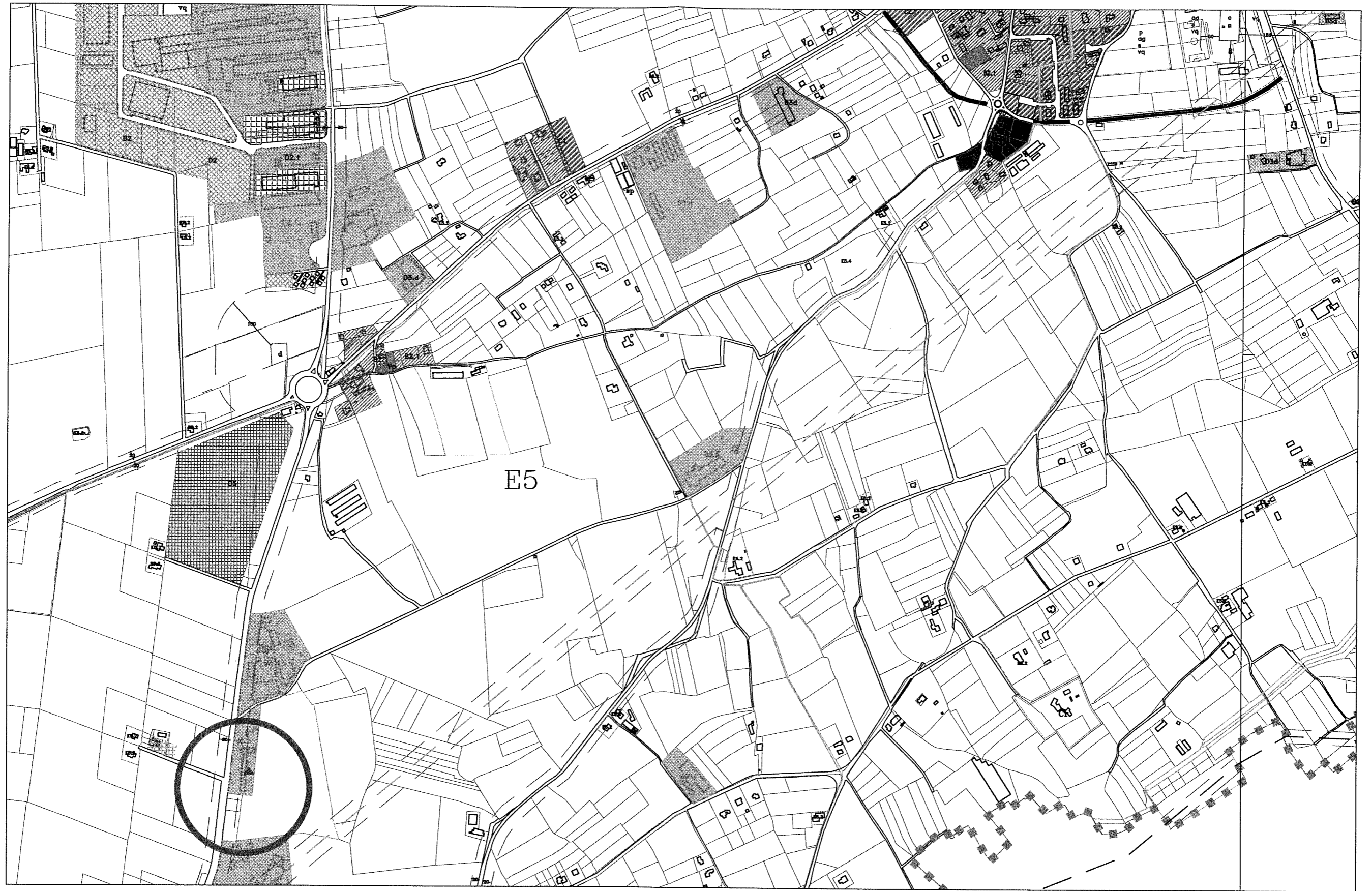
LOCALIZZAZIONE PUNTO DI VARIANTE SCALA 1:10000