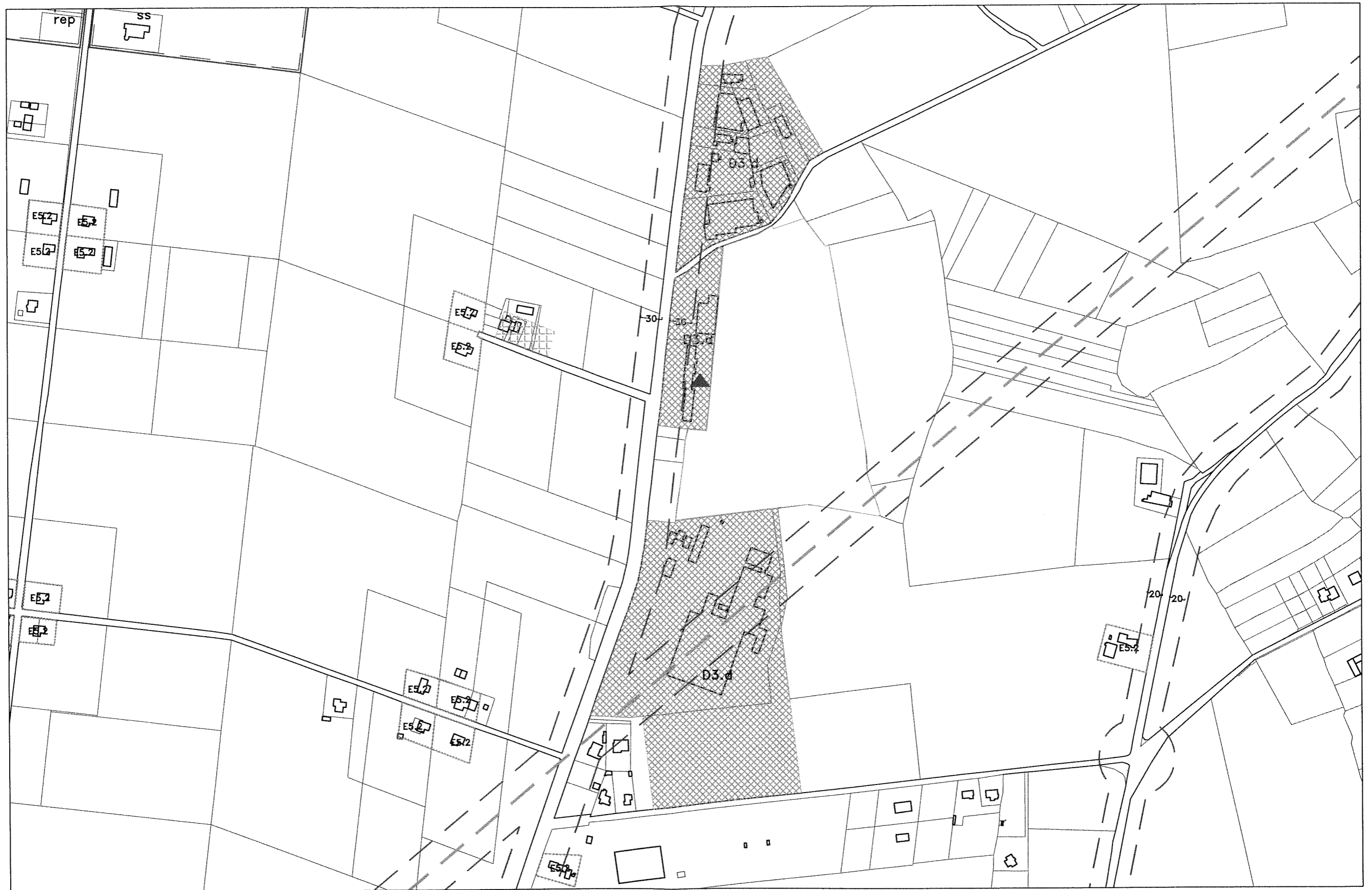
ESTRATTO PRGC VIGENTE VARIANTE n.72 1:5000